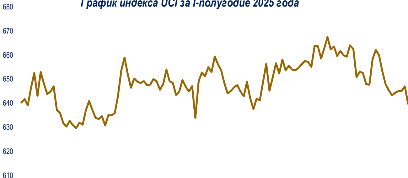
График индекса UCI за I-полугодие 2025 года

По итогам полугодия Индекс UCI снизился на 2,35%, закрывшись на уровне 639,75 пункта.